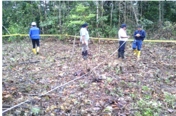
Figura 1. Levantamiento de información de los impactos generados