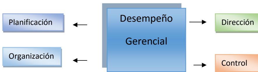
Figura 1: Desempeño gerencial.

Siguiendo estas ideas se puede decir que la gerencia es la gestión que se apoya en los procesos administrativos que se llevan a cabo en las instituciones donde se imparte la Educación Básica, de ahí que se requiera la presencia de un recurso humano que guie estas acciones para lograr los objetivos y metas previstas, como se presenta en la siguiente figura.