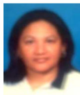
Lizzy Lastenia Sandra 2