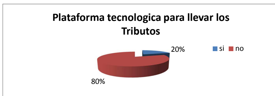
Gráfico N° 3